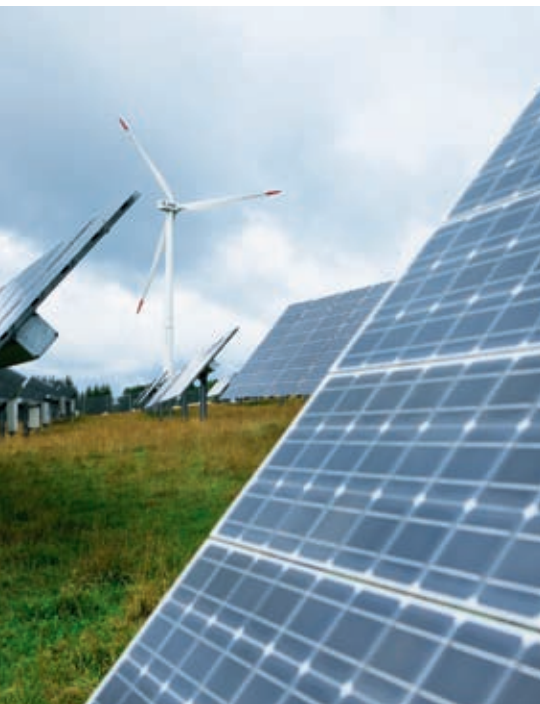
Die Anlage auf dem Mont-Soleil wird 20.