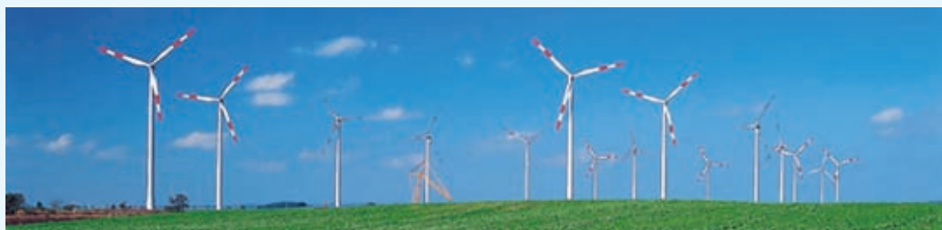
Neuer Eigentümer: Windpark Lüdersdorf-Parstein.

➤ Der Windpark im Bundesland Brandenburg, im Nordosten von Deutschland, ist seit Ende 2004 am Netz. Er weist eine installierte Leistung von 22,5 MW auf und produziert mit insgesamt