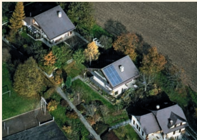
Die BKW springt für die KEV ein.

kommen. Neu setzt die BKW den Rücklieferarif höher an und vergütet zudem den ökologischen Mehrwert. Damit wird eine eigene Solaranlage noch attraktiver, zumal die Wartezeit auf Förderbeiträge des Bundes (kostendeckende Einspeisevergütung, KEV) lang ist und Subventionen zum Teil gar ausgeschöpft sind. Informationen sind hier zu finden: www.bkw-fmb.ch/einspeisung