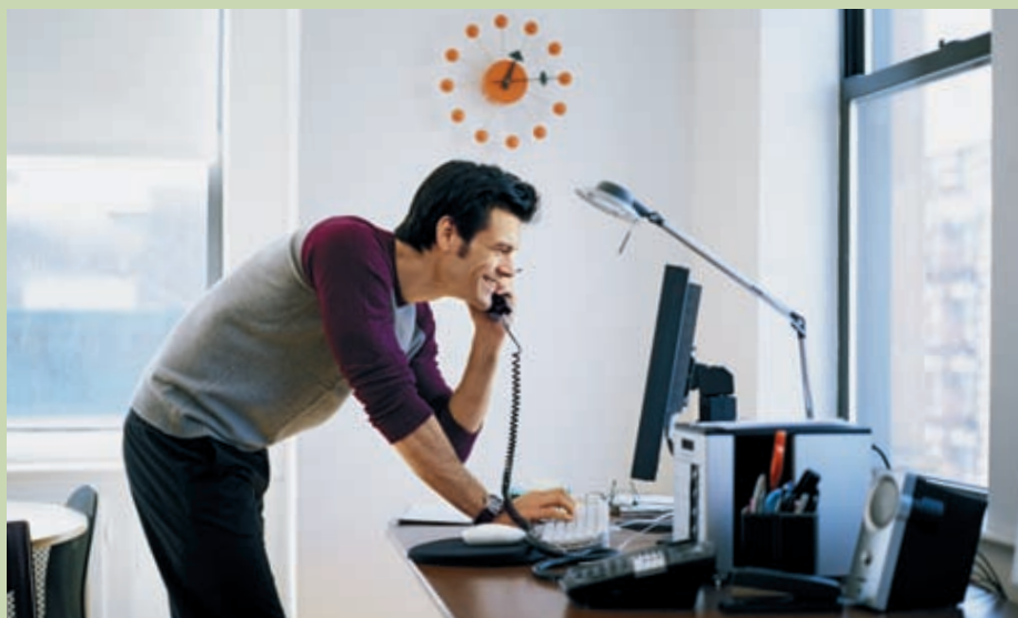
Wer zu Hause arbeitet, ist energieeffizient. Doch nicht unbedingt stromeffizient.

Mehr Menschen heisst auch eine immer dichtere Besiedlung. «Dadurch gilt es, die Infrastruktur stetig anzupassen.» Immer mehr überdachte Autobahnabschnitte bedeuten mehr Strombedarf – für den Bau und späteren Tunnelunterhalt (Beleuch-